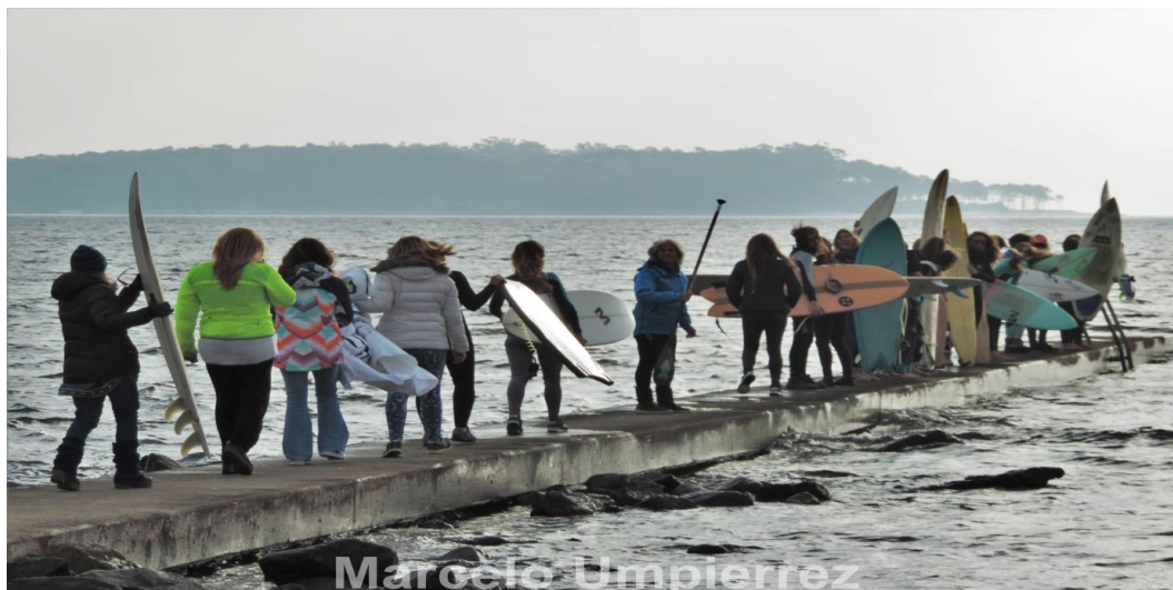
Imagen: Marcelo Umpierrez – Mujeres del Mar Punta del Este (Uruguay)

El PURS, plantea la promoción de oportunidades para la reducción de brechas de género, no solo en la composición o estructura de gobernanza de las reservas de surf, sino en procesos productivos y económicos bajos en emisiones de gases de efecto invernadero, identificando capacidades, promoviendo la resiliencia de las mujeres surfistas y costeras al cambio climático y enfocándolas como verdaderas agente del cambio para lograr las acciones de adaptación, la mitigación y su correcta aplicación.