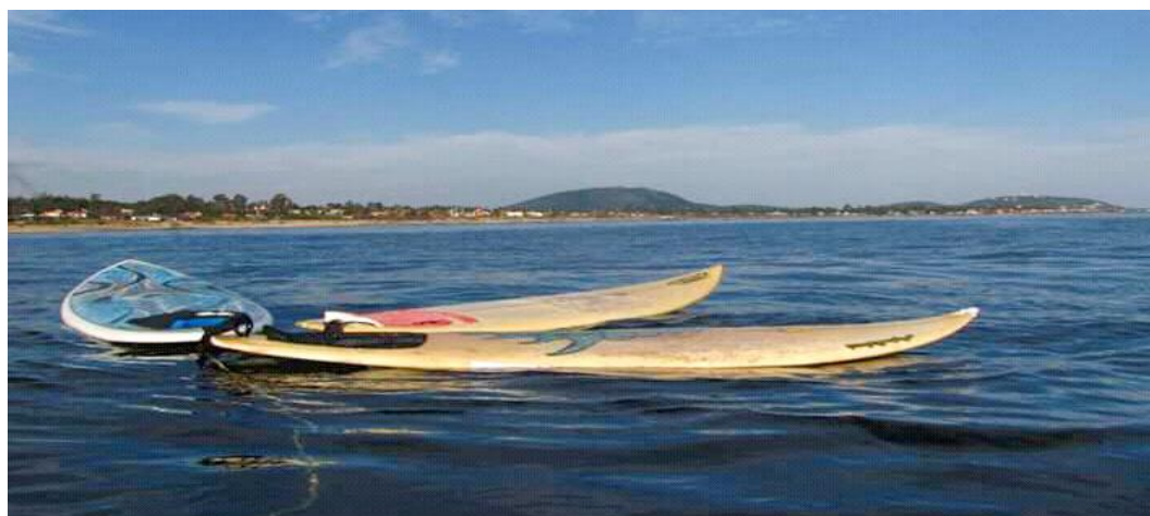
Imagen: El Lea – Playa Verde (Maldonado) Uruguay

El PURS, se plantea a eliminar esa visión, y ser un espacio para promover la participación de los jóvenes, considerando criterios de equidad e integración territorial, donde los jóvenes identifiquen problemas, y se sientan protagonistas en el debate y puesta en marcha de políticas públicas de alcance local y nacional aprovechando la proyección de las áreas donde existan reservas uruguayas de surf. El programa, en su operativa se compromete a diferenciarse de otras reservas de surf que existen en otros países, al establecer a nivel nacional lineamientos de participación en el área de la Juventud.